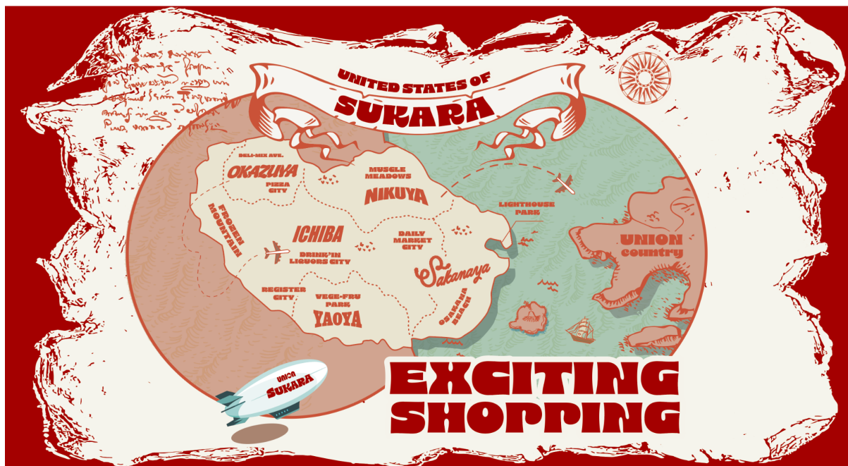
<SUKARA合衆国イメージ地図>

店内は、青果・鮮魚・精肉・惣菜・食料品といった部門を「州」に見立て、それぞれ独立した屋号とストーリーでユニークな買い物体験ができる工夫が施されています。各州が、県産はもちろん全国各地から厳選した商品と、自慢のオリジナル商品を「エキサイティングな価格」で提供をいたします。